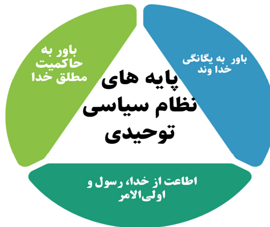
شکل ۱: پایه‌های نظام سیاسی توحیدی

نظام سیاسی توحیدی بر پایه باور به حاکمیت مطلق الهی و یگانگی خداوند استوار است. قرآن کریم در آیه ۵۹ سوره نساء، پیروی از خدا، رسول ﷺ و اولی الامر را به‌عنوان اساس این نظام برمی‌گزیند. سیاست‌مداران موحد در چهارچوب این جهان‌بینی، سه اصل بنیادین را رعایت می‌کنند: ۱. پذیرش انحصار حاکمیت برای خداوند؛ ۲. التزام به تشریح الهی؛ ۳. پیروی بی‌چون و چرا از دستورها. این نگرش، سیاست‌مداران را وادار می‌کند تا در تمامی تصمیم‌ها و برنامه‌ریزی‌ها، تنها به قوانین الهی استناد کنند و از هرگونه قدرت یا قانونی که در تعارض با شریعت باشد پرهیزند. چنین نظامی با سفارش بر عبودیت انسان در برابر خدا، هدف‌مندی آفرینش و اعتقاد به معاد، الگوی جامعی برای حکمرانی الهی ارائه می‌دهد که هم سعادت دنیوی و هم سعادت اخروی را در نظر می‌گیرد.