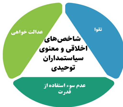
شکل ۴: شاخصه‌های اخلاقی و معنوی سیاست‌مداران توحیدی

پای‌بندی کارگزاران به پاسداری از امانات الهی از جمله «قدرت»، دارای تأثیرهای فراوانی همچون «رعایت عدالت در تصمیم‌گیری‌ها»، «پرهیز از هوای نفس و منافع شخصی»، «پاسخ‌گودانستن خود در برابر خدا و مردم» و «مبارزه با فساد و انحصارطلبی» و درنهایت، واداشتن جامعه به سوی عدالت و تعالی است.