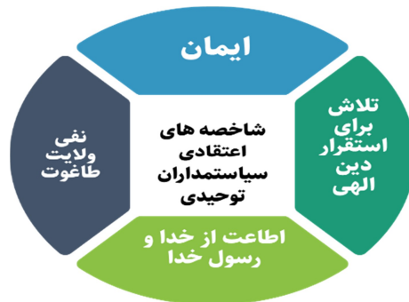
شکل ۳: شاخصه‌های اعتقادی سیاستمداران توحیدی

این شاخصه، تأثیرهای بنیادین بر اندیشه و عملکرد حاکمان اسلامی می‌گذارد و آن‌ها را ناگزیر می‌کند تا حکومت را ابزاری برای تحقق اراده الهی بدانند، عدالت و رفاه را در کنار تقویت معنویت پیگیری کنند و از قدرت برای خدمت، نه سلطه‌گری استفاده کنند.