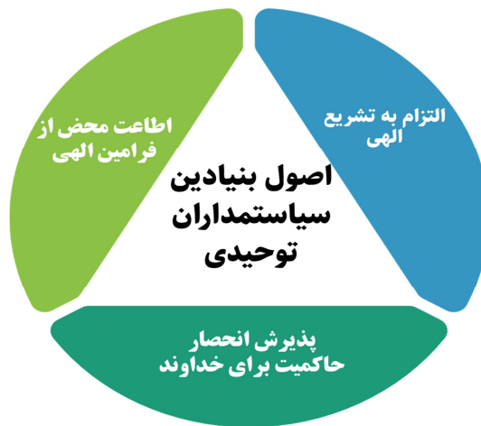
شکل ۲: اصول بنیادین سیاست‌مداران توحیدی

عادلان به شمار می‌رود. قرآن کریم با ارائه این الگوها، چهارچوبی جامع و روشن برای سیاست‌مداران توحیدی ترسیم می‌کند تا در راه هدایت و سعادت بشری گام بردارند. در ادامه، شاخص‌های دسته‌بندی شده «اعتقادی»، «اخلاقی - معنوی» و «سیاسی - اجتماعی» با رعایت این نکته که مرزبندی‌ها ضلَب و ریاضی نیستند آورده شده است.