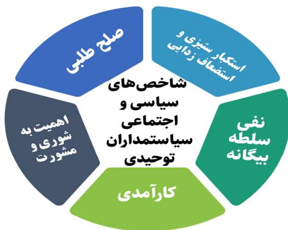
شکل ۵: شاخصه‌های سیاسی و اجتماعی سیاست‌مداران توحیدی

شاخصه‌های سیاست‌مداران توحیدی از منظر قرآن کریم